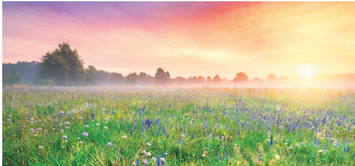
Die Gemeinde Ebikon beginnt im April mit dem Ansäen der neuen Blumenwiesen.

Als umweltbewusste Gemeinde beteiligt sich Ebikon an einem Pilotprojekt, bei dem schweizweit neue Blumenwiesen entstehen.