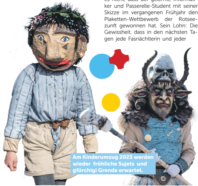
Am Kinderumzug 2023 werden wieder fröhliche Sujets und gfüchigi Grende erwartet.