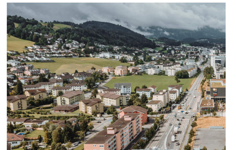
Der Gemeinderat und die Controlling-Kommission empfehlen, das Budget 2022 anzunehmen. Die Abstimmung findet am 28. November 2021 statt.

Der Gemeinderat und die Controlling-Kommission empfehlen den Stimmberechtigten, das Budget 2022 an der Urnenabstimmung vom 28. November 2021 anzunehmen und die Abstimmungsfrage mit Ja zu beantworten.