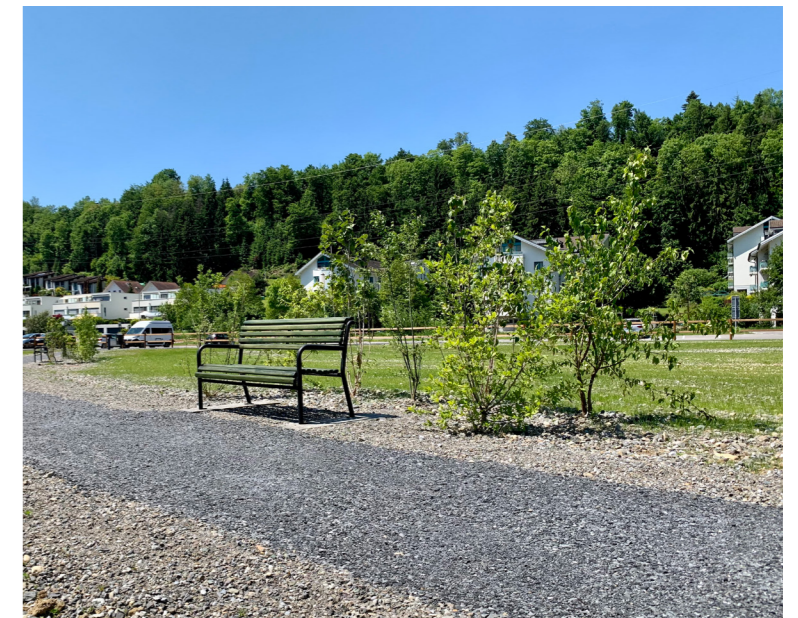
Die neugestaltete Blumenwiese auf dem Risch-Areal l6dt zum Erholen ein.

Zur F6rderung der Biodiversit6t und der Artenvielfalt verfolgt die Gemeinde Ebikon auch auf weiteren Fl6chen das Ziel, mehr Gr6n- und Steinfl6chen zu gestalten. So wurden beispielsweise entlang der Rischstrasse unlangst neue Bepflanzungen im Strassenraum realisiert.