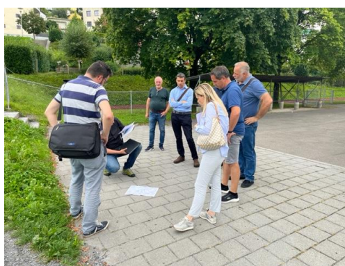
Impressionen der Begehung