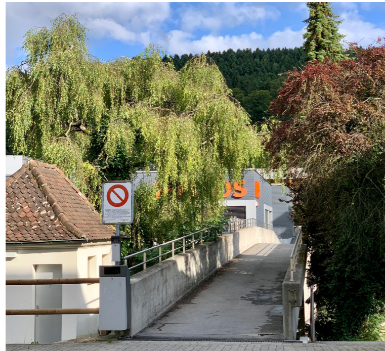
Die Personenüberführung zwischen der Dorf- und Schulhausstrasse wird während vier Tagen infolge Instandsetzungsarbeiten gesperrt. Die Arbeiten finden voraussichtlich zwischen dem 17. und dem 20. August 2021 statt.

Bei der Personenüberführung zwischen der Dorf- und Schulhausstrasse stehen Instandsetzungsarbeiten am Belag an. Die Arbeiten werden voraussichtlich zwischen dem 17. und dem 20. August 2021 durchgeführt. Während den Belagsarbeiten ist die Personenüberführung gesperrt. Zur Überquerung der Kantonsstrasse sind die nächstgelegenen Fussgängerstreifen zu benutzen.