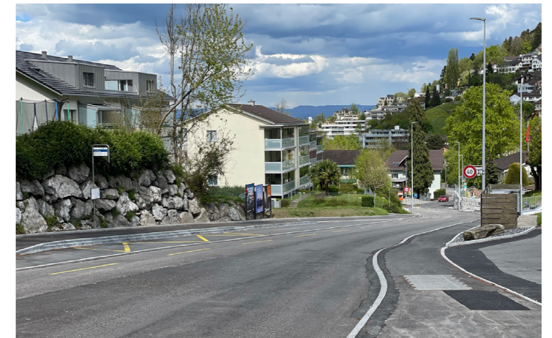
Als finaler Deckbelag wird der Typ SDA 4 eingebaut. Dieser ist zwar nicht ganz so langlebig, weist dafür besonders lärmindernde Eigenschaften auf.

Nachdem gegen die Änderungsaufgabe vom 2. Juli 2021 Einsprache erhoben wurde, entschied sich der Gemeinderat für den umgehenden Abbruch der Änderungsaufgabe. Statt-