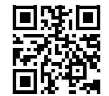
QR-Code scannen und PUEK-Bericht einsehen.

«Für die PUEK war die achtsame Auseinandersetzung mit unserem wunderbaren Naturschutzgebiet und Lebensraum rund um den Rotsee eine Bereicherung. Diese Erfahrung und die fachkundigen Ausführungen von